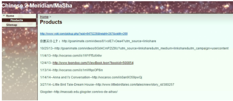
图 交互式远程汉语教学课学生电子档案袋样例